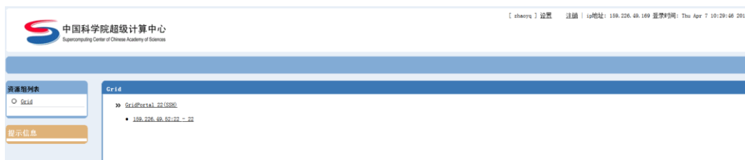
图 5 VPN 可用资源窗口

注意: 在访问过程中, 不要关闭图 5 所示的 VPN 可用资源窗口, 否则 VPN 将直接断掉。