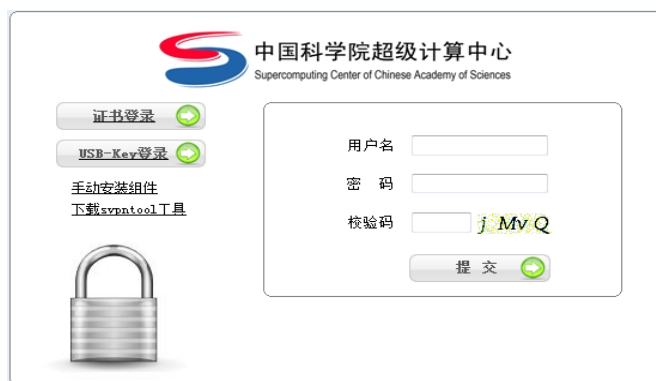
图 2 VPN 登录界面