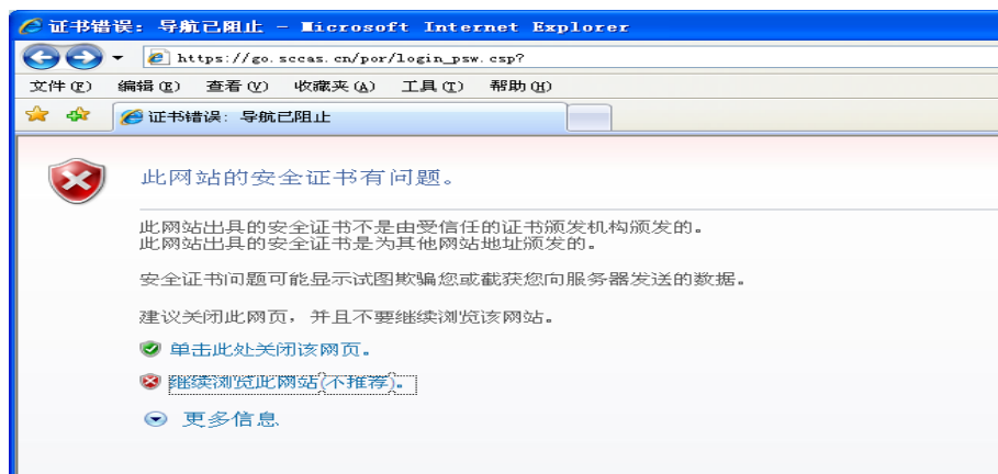
图 1 证书警告页面